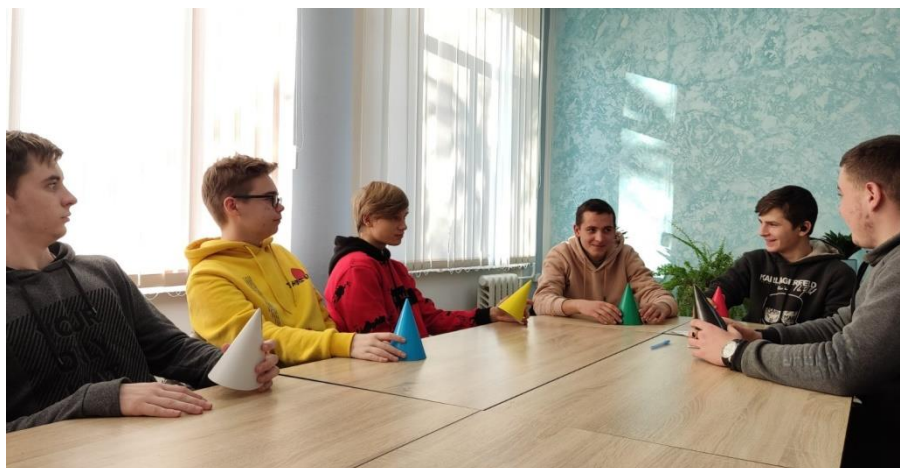
Рис. 2 Вправа на розвиток критичного мислення «Шість капелюхів»

Діалог та співпраця є важливими інструментами для досягнення ефективної взаємодії учасників виховного процесу. Діалог дозволяє учасникам взаємодії краще розуміти погляди, цінності та перспективи інших сторін. Це сприяє створенню атмосфери взаємоповаги та сприяє спільному вирішенню проблем. Взаємодія через діалог та співпрацю стимулює критичне мислення, оскільки учасники мають можливість аналізувати ідеї, обговорювати аргументи та виробляти власні погляди на проблему. Взаємодія залучає учасників до виховного процесу, підвищуючи їхню мотивацію та зацікавленість у навчанні. Колективне вирішення проблем та спільна робота сприяють почуттю відповідальності та приналежності. В цілому, діалог та співпраця є важливими складовими ефективної взаємодії учасників виховного процесу, оскільки вони сприяють розвитку відкритості, співпраці та взаєморозуміння всіх сторін.